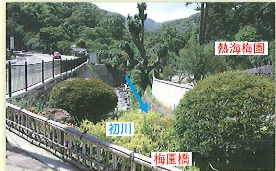
写真4 取水口があった辺り 梅園橋から上流を撮影。初川の流れは急でしたが、水量は多くありませんでした。

又、取水口があった熱海梅園入口前の梅園橋付近にも行ってみました。当時を偲ぶ遺構などは見当たりませんでした。（写真4参照）