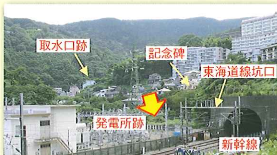
写真3 当時（写真1）と同アングルの写真

次に、当時の写真（写真1）と同じアングルの写真を撮るため地点探しをしました。東海道線、新幹線、変電所などが新たに造られていて、ベストポジションに近づくことが出来ませんでした。ほぼ同じアングルの写真3を撮ることができました。