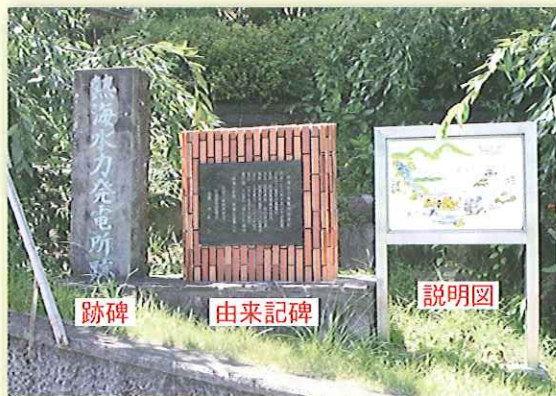
写真2 熱海発電所跡碑と由来記碑

また、反対側（坑口真上）には、トンネル工事の犠牲者67名の殉職者慰霊碑がありました。