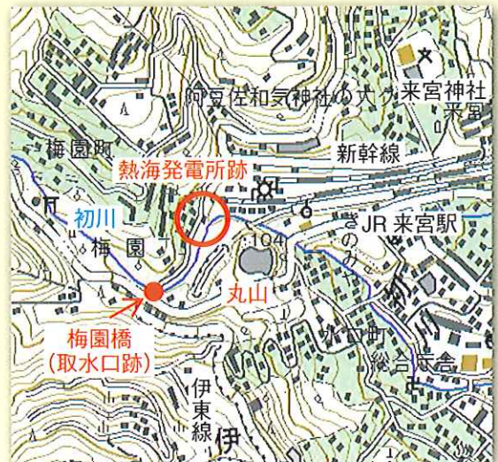
図2 現在の地図 国土地理院2万5千分の1地形図使用

現地を訪ねたところ、同トンネル坑口上は広場になっており、その一角に「熱海水力発電所跡碑」「熱海水力発電所由来記碑」などがありました。