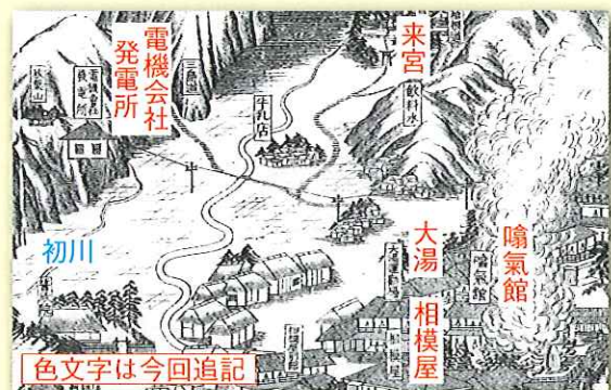
図3 豆州熱海全図に描かれた発電所（明治32年） 左上の発電所から中央部に、電線と電柱が描かれています。