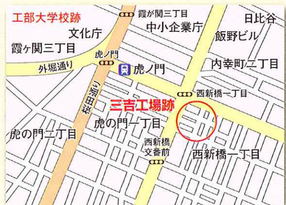
図2 現在の地図 目標は虎ノ門セントラルビル