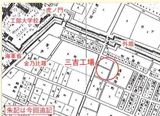
図1 明治20年(1887)の地図 三吉工場設立の4年後