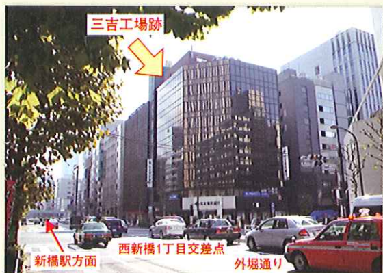
写真2 三吉工場跡 目標は虎ノ門セントラルビル