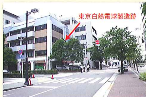
写真5 現在の「芝三田四国町」の場所 住所：港区芝3-24-5 目標：港区立芝地域包括支援センター