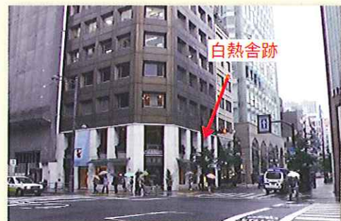
写真4 現在の「京橋区南鍋町」の場所 住所：中央区銀座5-3-12 目標：壹番館ビル

明治25年(1892)、製造設備の拡張のため南鍋町1丁目1番地(現銀座5-3-12、写真4)へ本社・工場を移転しました。レンガ造り2階建1棟及び木造2階建て1棟でした。さらに、明治29年(1896)には東京白熱電燈球製造株式会社に社名変更、2年後の明治31年(1898)には芝三田四国町(現港区芝3-24-5、写真5)に新工場を建設し移転しております。この東京白熱電燈球製造株式会社は、後に、東京電気、東京芝浦電気、現(株)東芝となっていきます。この流れから、白熱舎は現(株)東芝の源流の一つとされています。