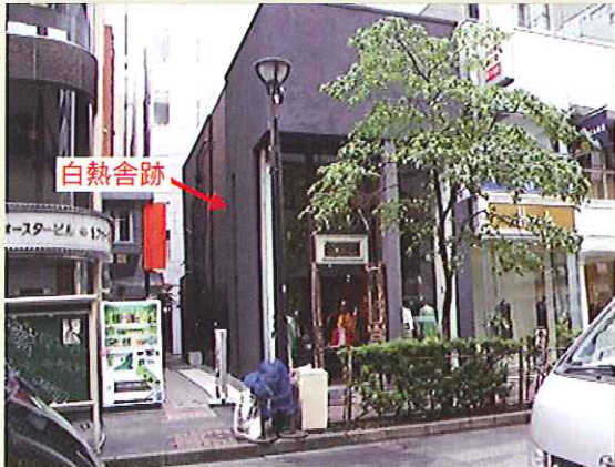
写真3 白熱舎跡近景