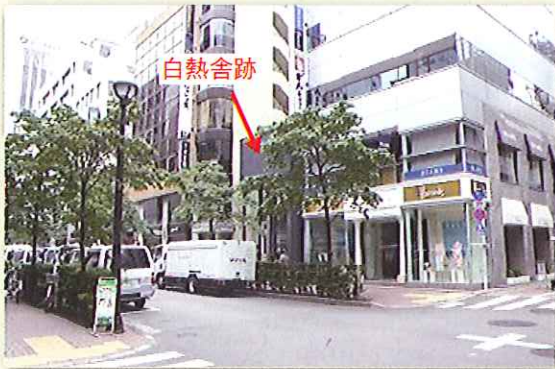
写真2 白熱舎跡遠景 北側交差点から撮影