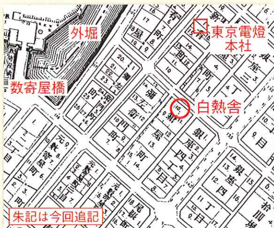
図1 設立6年前（明治17年）の地図 東京実側全図 中央区立京橋図書館蔵