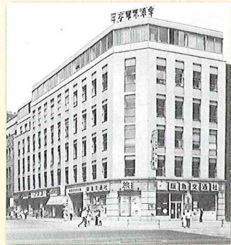
写真3 昭和31年、改修後の電気協会会館