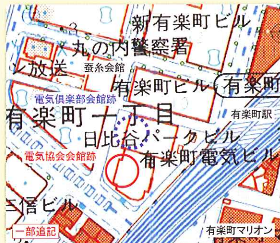
図2 現在の地図 国土地理院1万分の1地形図使用(日本橋)