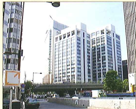
写真4 現在の有楽町電気ビル (左:南館 右:北館) 晴海通りの数寄屋橋より撮影。手前はJRの高架

電気協会は昭和50年(1975)10月に同じ場所に建設された有楽町電気ビル北館に入居し、現在に至っています。