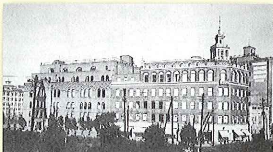
写真2 昭和9年頃の電気協会会館(右)と電気倶楽部会館(左)

この建物には、協会の本部事務所と関東支部が置かれ、また会館の一部には電気奨励館が設けられました。電気奨励館では、電気機器材料の紹介や見本市などが開催され、当初関東支部がその運営に当たっていましたが、翌年に職制の改正に伴い分離独立しました。