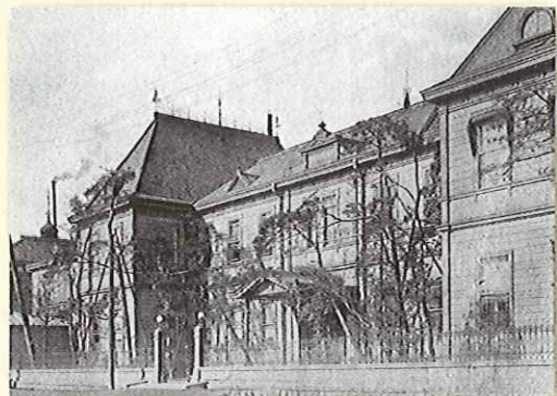
写真3 「麹町区有楽町3丁目」の本社ビル

・明治36年～大正14年 ・この本社ビルは、大正12年の関東大震災で焼失したため、その後、芝区桜田本郷町へ移転しました。