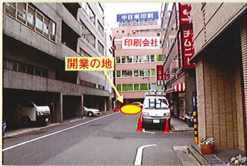
写真1 開業の地 正面ビル前(永代通りから撮影)