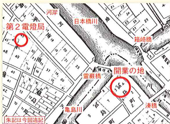
図2 東京実測全図（明治17 京橋図書館蔵）

現地を訪ねたところ、開業の地と思われる場所は道路で、印刷会社ビル（写真1）の前、住所は中央区新川1-1先で、辺りを調べてみましたが、当時を偲ぶようなものは見当たりませんでした。