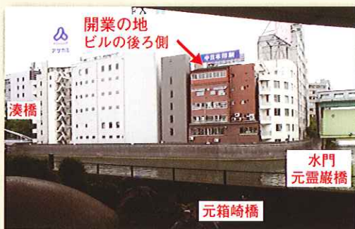
写真2 開業の地遠景(図1とほぼ同じアングル) 関東大震災後の復興事業で、河岸道路部は民地化され、現在、ここにビルが建っています。このため、開業の地を直接見られません、茶色のビルの後側です。